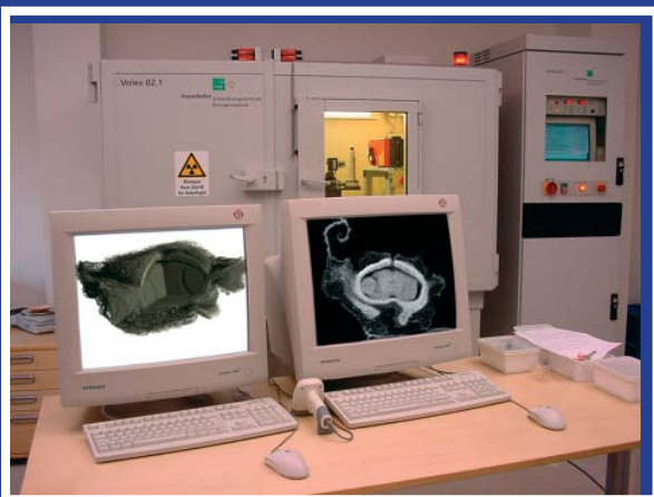
Vue interne longitudinale d'une graine monogème